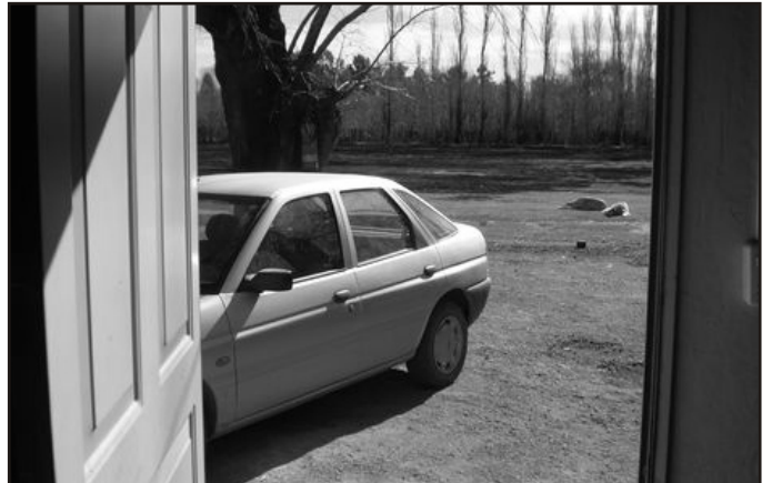
Hace unas semanas, el fuego sorprendió a una vecina a pocos metros de la puerta de su casa.

Unas 700 personas viven o están construyendo sus viviendas en un entorno natural paradisíaco. Algunos trabajan en Cinco Saltos o Cordero. Otros crían animales. En muchos casos, han levantado viviendas a pocos metros del arroyón sin considerar la posibilidad de que se produzca una crecida. Unos 500mts serían jurisdicción de Cinco Saltos, el resto depende de la vecina ciudad de Clte. Cordero. De hecho, las mensuras, los impuestos y la colocación de los postes de electricidad han sido solicitados en esa ciudad. No obstante, los vecinos se sienten olvidados por las autoridades. La semana pasada, el arroyón fue noticia por dos hechos: uno, el más difundido, una importante tala de arbustos; la otra, los frecuentes incendios que se producen en el lugar que no sólo hacen peligrar el entorno natural sino los bienes materiales de los vecinos y hasta la propia vida. Dos noticias, una misma problemática.